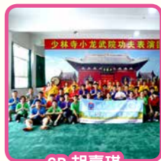
6B 胡嘉琪 河南文化經濟考察之旅

我們前往少室山下眾多武術學校之一去習武。歡迎我們的，是一場浩蕩而令人瞠目結舌的表演。因是表演形式，一拳一腳剛猛中帶柔和，富觀賞性，少了點以一敵百的姿態。「倒不能怪他們，身處文明社會，武功抵禦外敵、鋤強扶弱的功能不復存在了。」導遊不經意的話語，給我一個完滿的答案。忽然出現眼前的，是一名教授軟骨功的小師傅——一名十二歲，只有約一點三米高的師傅。他認真又不失嚴肅，像是要把功夫傾囊相授，可是，我等凡夫俗子，還是耍耍棍、踢踢腿吧。