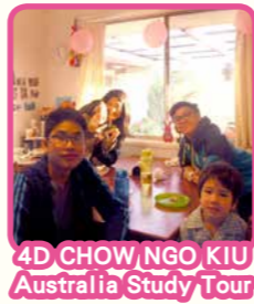
4D CHOW NGO KIU Australia Study Tour

I will not fail you. For what you have done for me, this is the least I can do to repay you. Wish you guys the brightest of future.