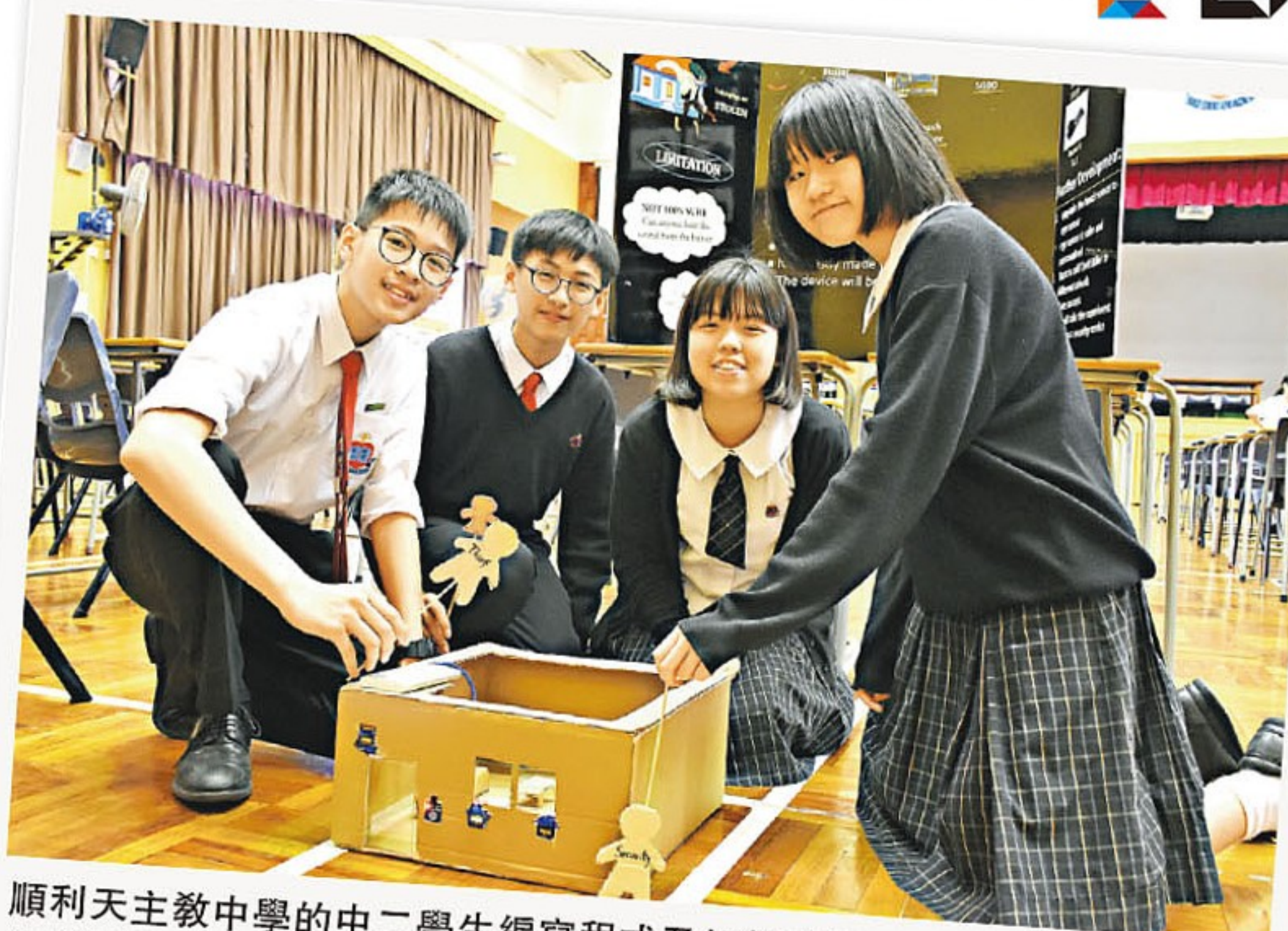
順利天主教中學的中二學生編寫程式及設計產品，解決生活的難題。學生更要學習應對老師對產品的質疑，考驗應對能力。圖中學生的作品為「課室防盜裝置」。

長者記性較差、「低頭族」易生交通意外，這些都是日常生活中常見的問題，順利天主教中學的中二學生以創意編寫程式及設計產品，以科技一一解決這些困難。對他們而言，設計產品不只講求技術，更需要良好的溝通能力，因為他們都要充當「金牌 Sales」，向各嘉賓及教師推銷其產品。